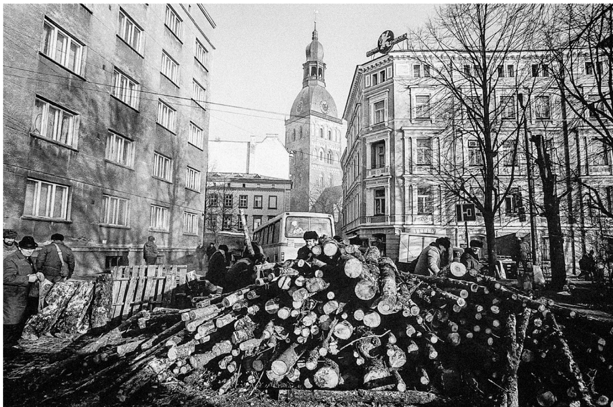
Баррикады в Риге, возле которых защитники независимости вели сражения с ОМОНОм, 1991 год

– Является ли это простым совпадением – надо изучать, и до сих пор никто этого не делал. Впрочем, тут надо понимать, что все балтийские республики функционировали как перерабатывающие цеха продовольствия, которое уходило в основном в Москву и Ленинград. До начала 1970-х годов, видимо, здесь что-то оставалось, а потом, возможно, было принято какое-то решение, и мясные продукты в Латвии практически исчезли. А вот в Литве почему-то такого не случилось. Это всегда списывали на то, что в Литве первым секретарем был [Антанас] Снечкус и была другая Компартия, которая лучше могла постоять за местные интересы, чем наша. У них и дороги были лучше, и, по-видимому, отношение к ним со стороны центра было иным.