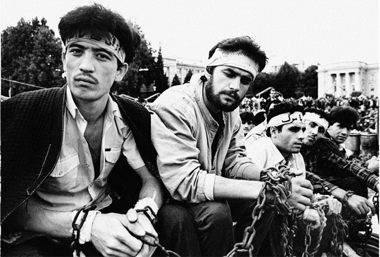
Выступление сторонников суверенитета Таджикистана в Душанбе; предположительно, сентябрь 1991 года

– Были ли на этом фоне заметны, скажем, исламские активисты?