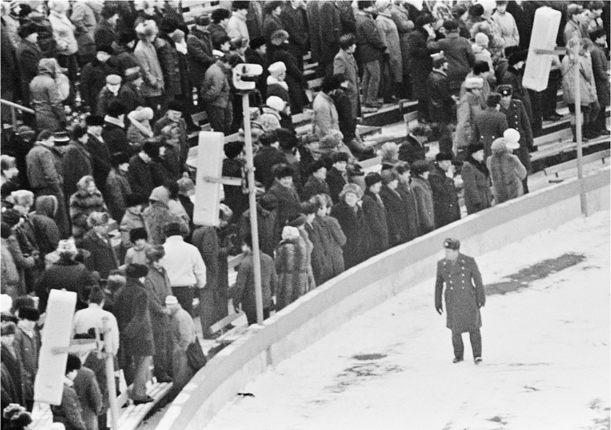
Первый разрешенный властями БССР оппозиционный митинг в Минске на стадионе «Динамо», 19 февраля 1989 года

– Двадцать пять лет назад Советский Союз распался именно в тот момент, когда вам важнее всего было добиться от России поставок нефти и газа. Сегодня главное в отношениях Москвы и Минска – по-прежнему поставки российских углеводородов.