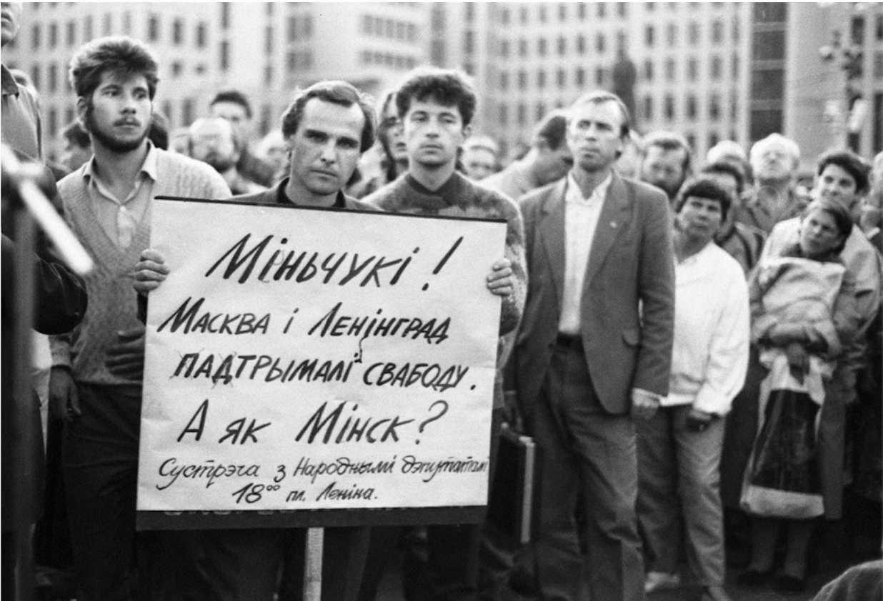
Учаснікі мітынгу протыв ГКЧП в Мінске на плошчадзі Леніна (сейчас – плошчадзь Незавіскасці), август 1991 года

думаю, что те политики, которые заявляют, что творчески подошли к процессу, в большинстве случаев ошибаются. Надо очень хорошо освоить политическое ремесло. А вот гениальные политики – например, Бисмарк или Черчилль – действительно были творцами и находили верные решения, естественно, в интересах своих стран.