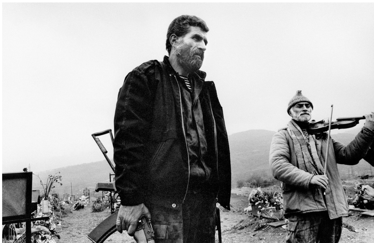
Похороны армянского солдата, Степанакерт, Нагорный Карабах, 1994 год

карабахского движения возникло ощущение, что мы можем обрести независимость.