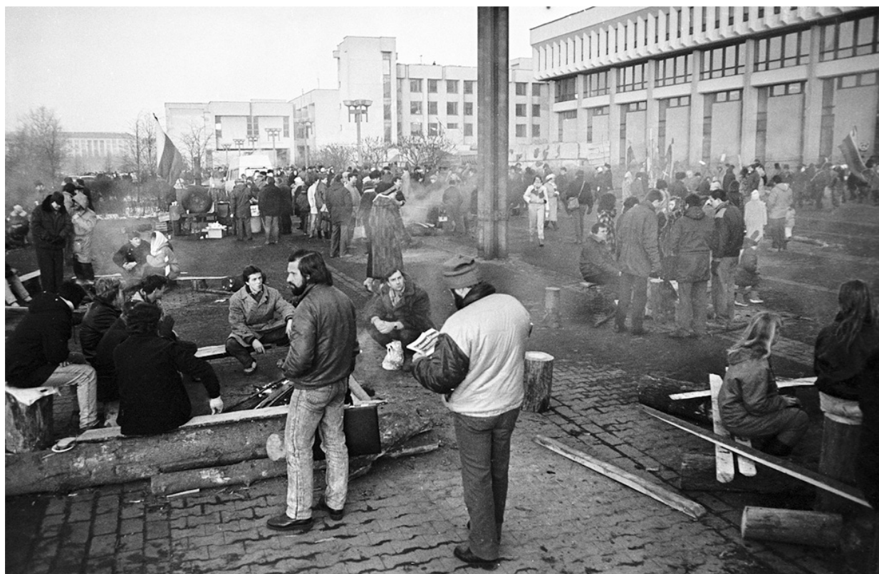
Демонстрация в защиту независимости у здания Литовского сейма, январь 1991 года

поработать» над этим документом, но тот отказался: «Нет, я свое сделал. Комиссия подтвердила. Если отвергаете – берите ответственность на себя». На том бурном вечернем заседании все было уже решили, что резолюция отклонена, но прения не стихали. И вдруг кто-то из президиума сказал, что есть еще один человек, который просит право голоса. Посторонний человек – невозможное дело для Съезда народных депутатов! Кто он? Старый архивариус. Ну, дадим ему выступить. Конечно, это Горбачев с Лукьяновым уже согласовали. Вышел старичок и сказал: «Есть протоколы, я видел. Они лежат в самом секретном фонде Молотова». На следующий день приняли постановление, в котором было сказано, что протоколы – неправомочные и съезд их объявляет не имеющими юридической силы с момента подписания. По-английски это называлось null and void. Протоколы были названы преступными, и сказано, что эти преступления Сталина были сделаны за спиной благородного советского народа (и благородной Компартии).